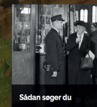
Sådan søger du