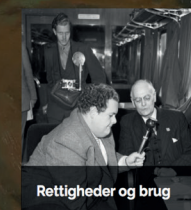
Rettigheder og brug