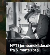
NYT i jernbanekilder.dk fra 6. marts 2019